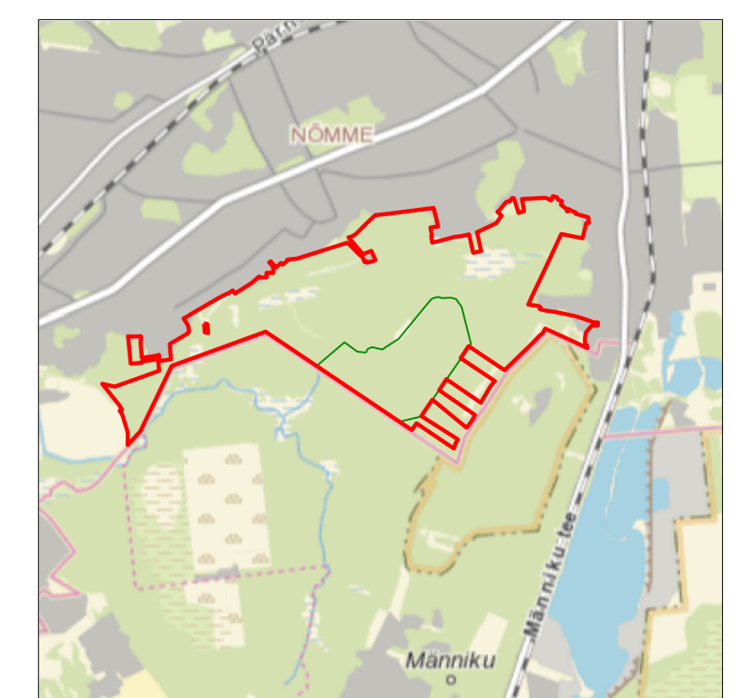
Kaarditeht nr 6334 Tallinn